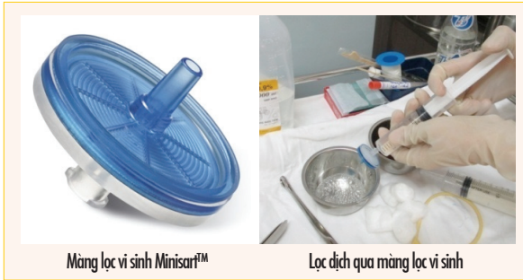
Màng lọc vi sinh Minisart™