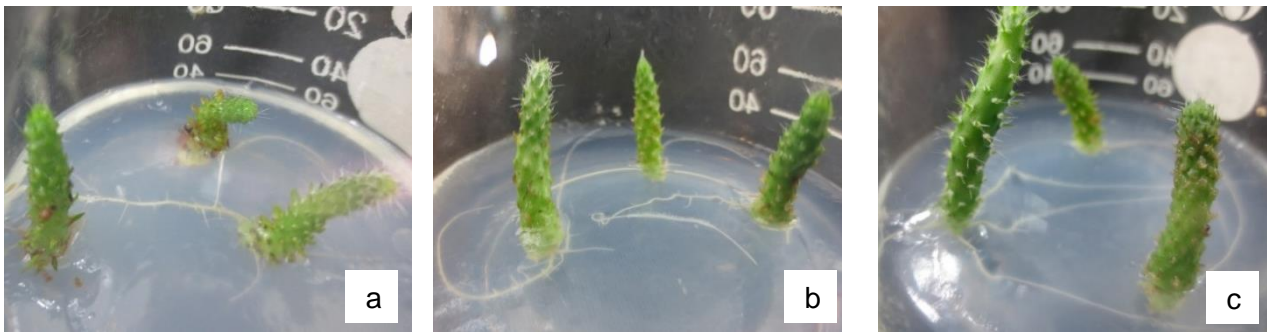
Hình 3.3. Sự hình thành rễ từ chồi in vitro 8 tuần tuổi sau 3 tuần nuôi cấy trên môi trường có bổ sung auxin. Thanh ngang 5mm. Đối chứng, (B) IAA 0,5 mg/l (C) IBA 0,5mg/l