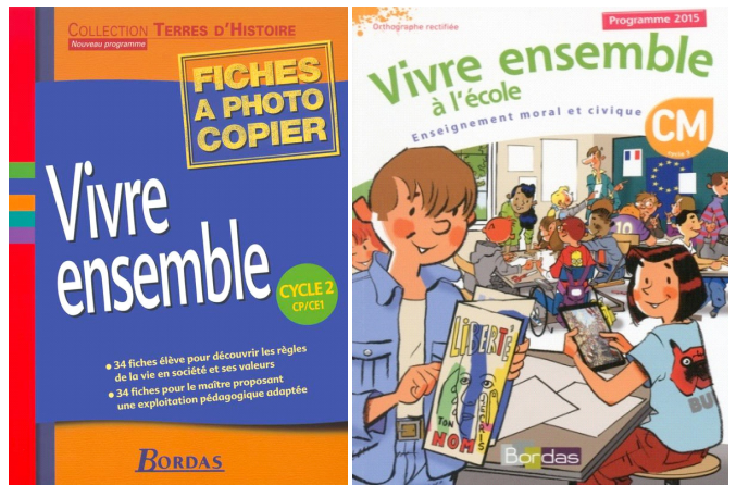
Hình 1: Trang bìa cuốn SGK Vivre ensemble à l'école của NXB Bordas phát hành năm 2017

Cuốn Vivre ensemble à l'école (chủ yếu dành cho HS lớp CM1 và CM2 tương ứng với lớp 4, lớp 5 ở Việt Nam) là