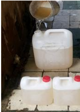
Hình 2. Ảnh chụp lấy mẫu tại hiện trường.

Phương pháp lấy mẫu và xử lý mẫu dựa vào TCVN 5992:1995 (ISO 5667-2: 1991) Kỹ thuật lấy mẫu nước và TCVN 5993:1995 (ISO 5667-3:1985) Bảo quản và xử lý mẫu nước.