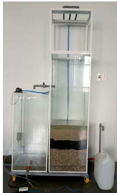
Hình 3. Mô hình khử phèn trong nước ngầm

Nồng độ sắt đầu vào trong nước giếng tại Khu vực huyện Nhà Bè TP.HCM là 3,8731mg/l khá cao, sau khi xử lý giảm xuống còn 0,1895mg/l nhỏ hơn so với quy định trong QCVN 01:2009/BYT và QCVN 02:2009/BYT. Hiệu quả xử lý phèn của mô hình đạt hiệu suất lên đến 95,1%.