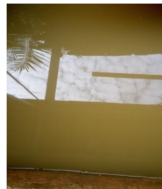
Hình 1 Nguồn nước ngầm sau khi được bơm lên. Khu vực lấy mẫu thuộc Huyện Nhà Bè, TP.Hồ Chí Minh.