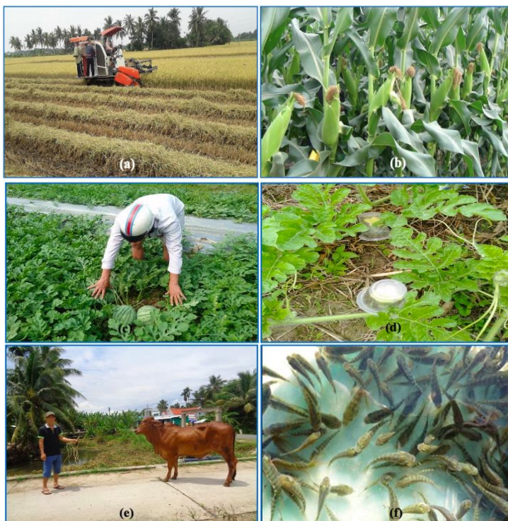
Hình 2. Một số mô hình SKNN thích ứng XNM thí điểm tại tỉnh Vĩnh Long: (a) Giảm lượng giống trong sản xuất lúa tại huyện Vũng Liêm; (b) Trồng bắp nếp lai cao sản tại huyện Trà Ôn; (c,d) Trồng dưa hấu trên nền đất lúa thiếu nước tưới tại huyện Mang Thít; (e) Nuôi bò sinh sản chất lượng cao tại huyện Mang Thít; (f) Nuôi cá rô phi vằn thích ứng XNM tại huyện Vũng Liêm.

Ghi chú: (i) Trong mô hình; (ii) Chênh lệch so với ngoài mô hình